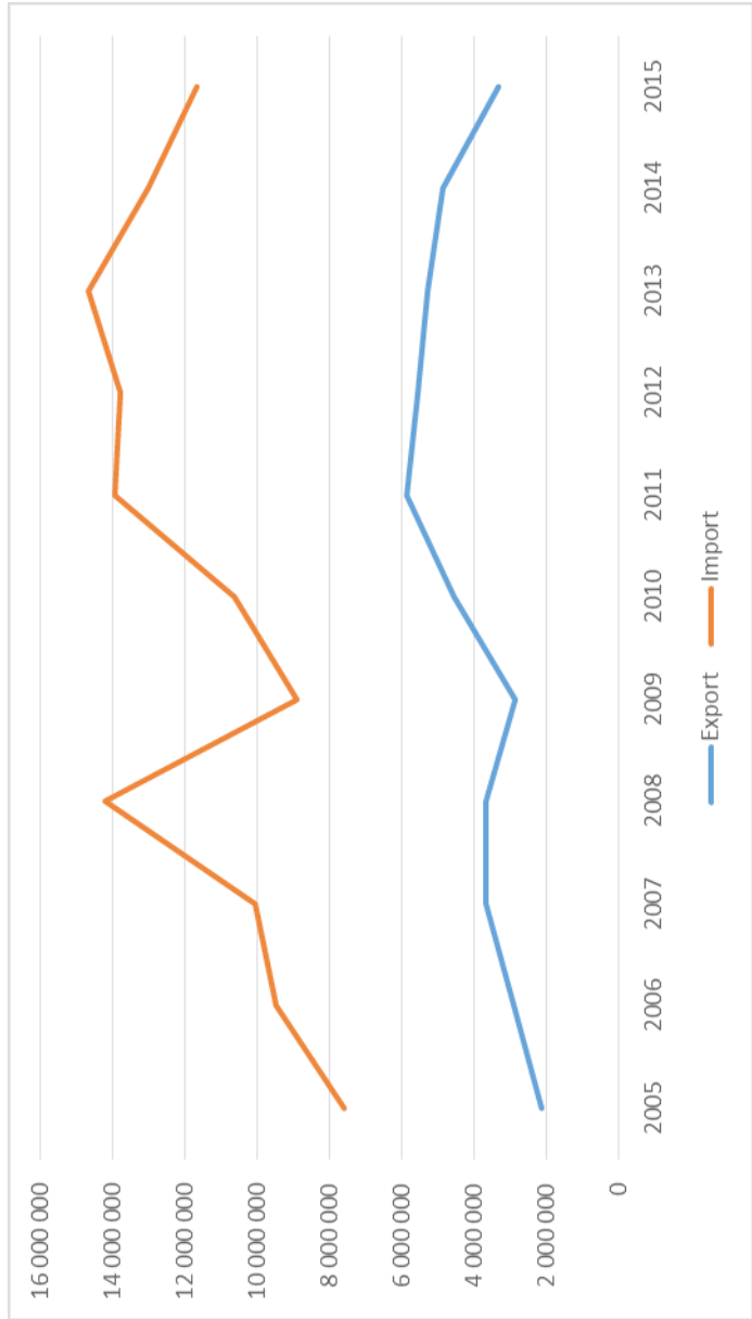
1. ábra 28 A kubai áruexport és import értékének változása 2005–2015 között (1000 dollár)