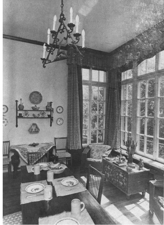
A Bérc utcai villa, bejárat és előszoba.

Budapest ostroma alatt, 1944 decemberében a villát kifosztva távozott a német SS vezetés. A Bérc utcai épület Budapest ostroma alatt jelentősen megsérült, már 1944 őszén ismeretlenek gránátot